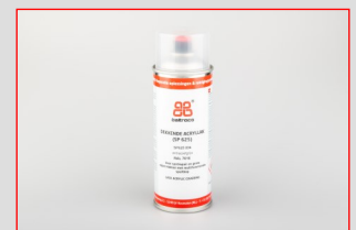
SP625 Dekkende acryllak met multifunctionele spuitkop

Hulpmiddelen bij de verwerking van Hoxen