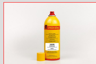
Kö 348 Structuurlak