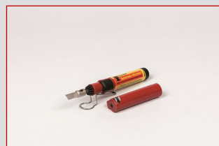
Kö 439 001 Gassmelter